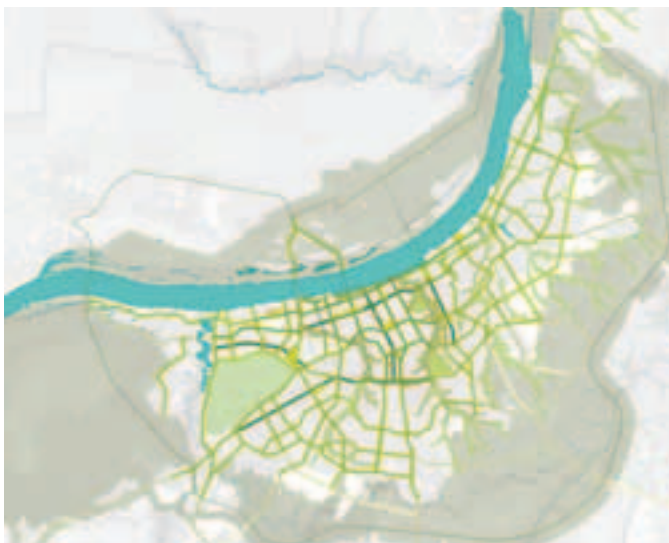
Het netwerk van openbare ruimten.

Een van de belangrijke voorbeeldprojecten van Perm die op korte termijn worden aangepakt is de herontwikkeling van het Perm Embankment