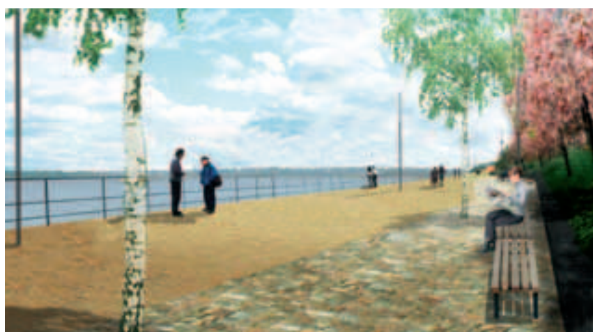
Impressie van de boulevard aan de waterkant.