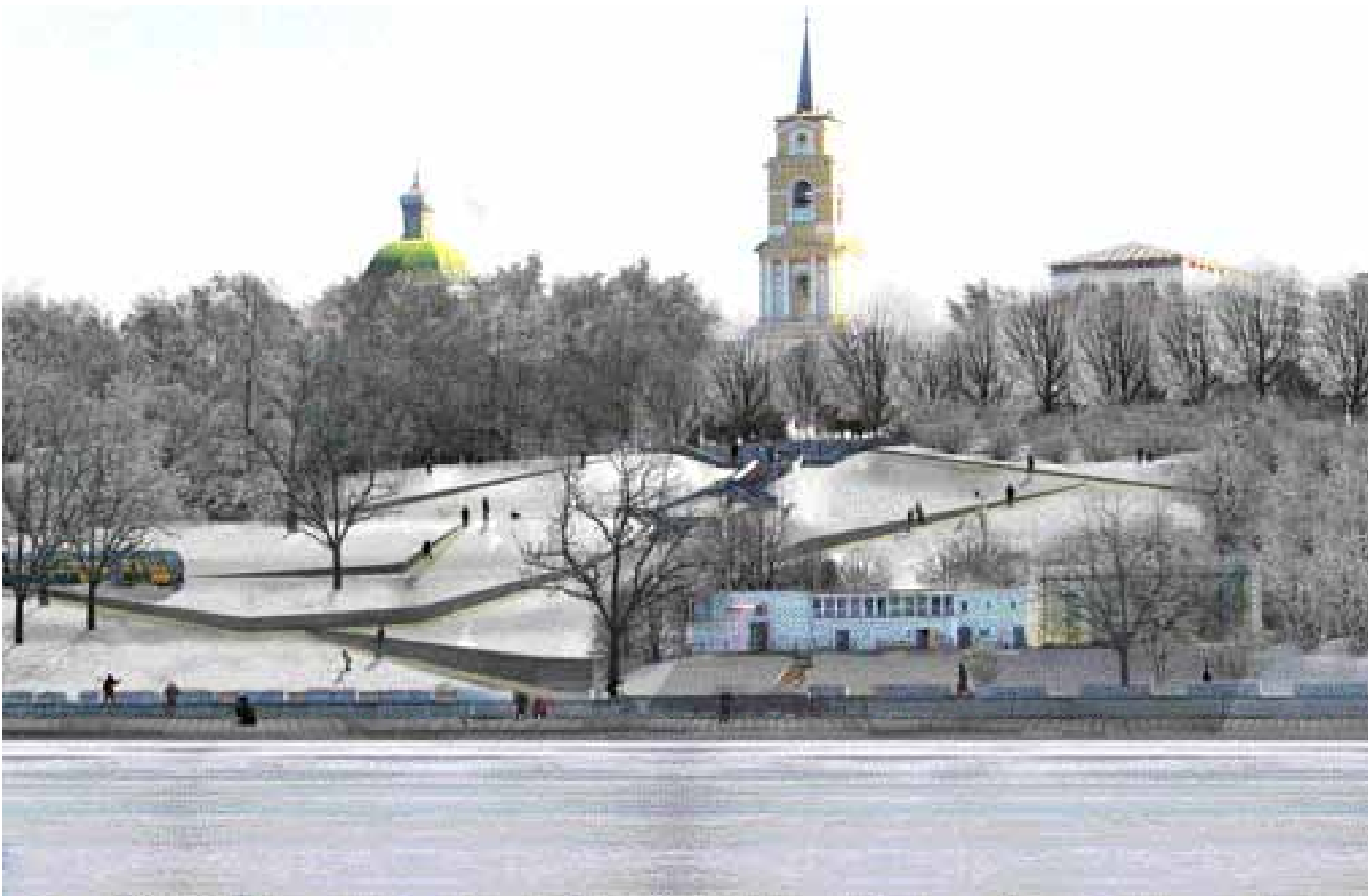
Impressie vanaf de rivier op het nieuwe Perm Embankment City Park.