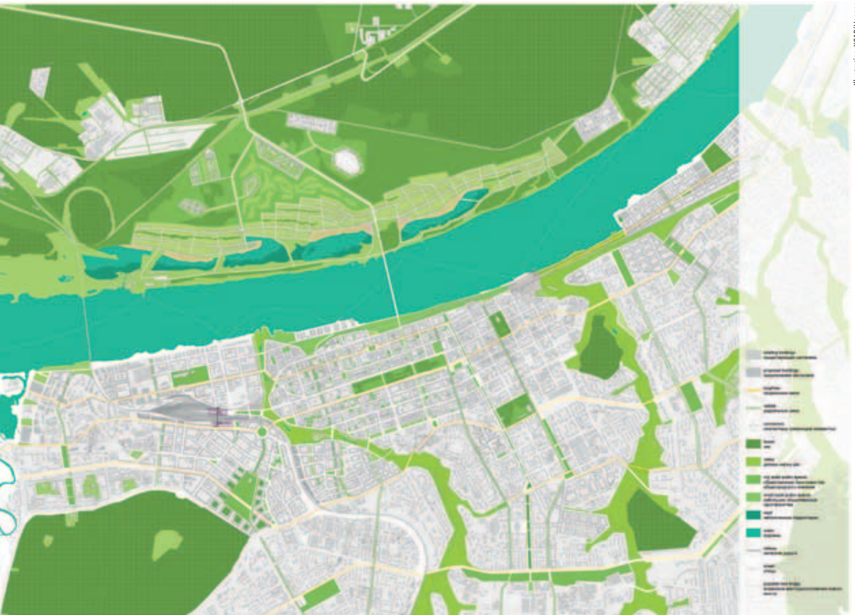
Het masterplan voor Perm.