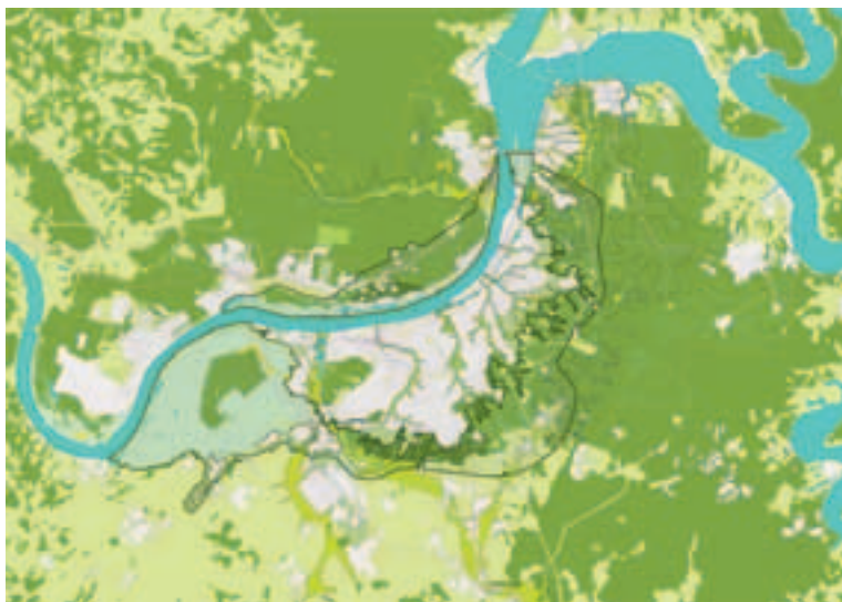
Bureau Hosper bracht de landschappelijke kenmerken van de stad in kaart. Goed zichtbaar zijn de groene valleien.