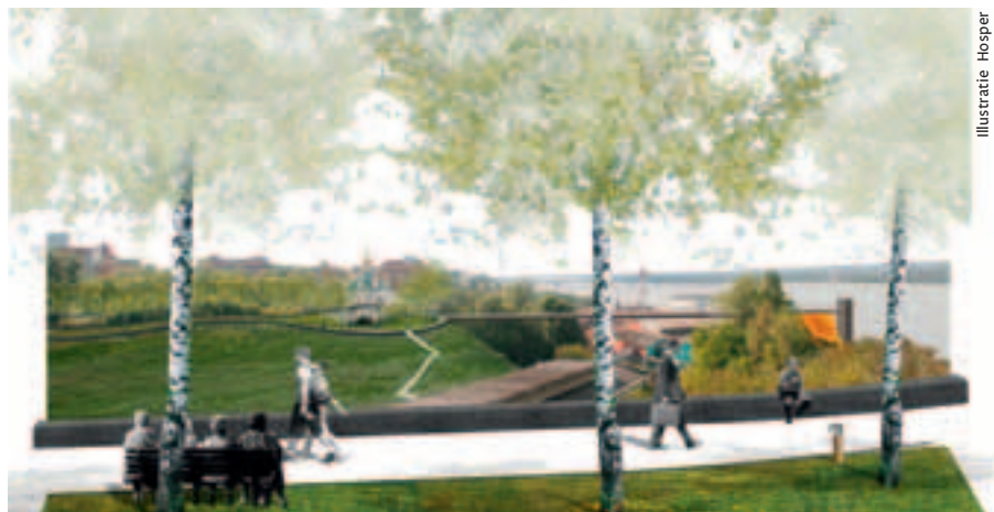
Voorstel voor de herinrichting van de Yegoshika vallei. Links de bestaande situatie.