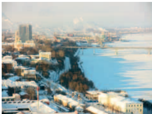
Het huidige waterfront van Perm.

Op de vraag of werken in Rusland de ontwerpers goed is bevallen, antwoorden zij positief. Ze zijn te spreken over de vrijheid die zij in het proces van het ontwerp gekregen hebben, waardoor het bijvoorbeeld mogelijk was om zelf te ontwerpen aan meubilair voor het park. Ook het ontsnappen aan de stroperige Nederlandse overlegcultuur is wel eens prettig. Er zijn minder partijen betrokken waardoor er meer controle ontstaat in het project en ontwerpkeuzes meer in eigen hand gehouden kunnen worden. Hierdoor ben je als ontwerper in staat een meer compleet plan uit te dragen.